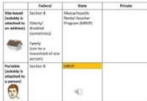
Affordable and subsidized housing options for people with disabilities in Massachusetts